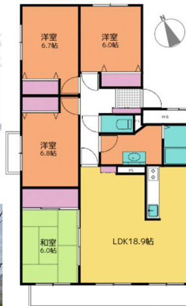
現況を優先します